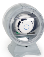
Obudowa kanałowa czujki dymu